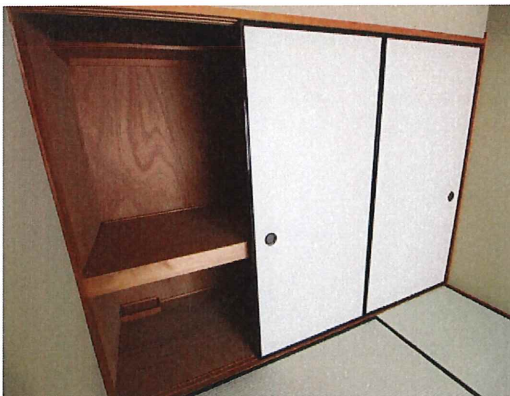
※和室→洋室（写真準備中）